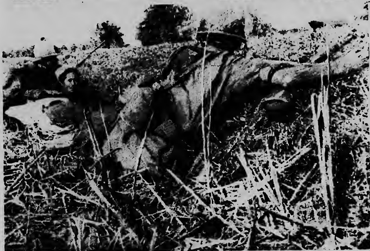
Trung Lap, Vietnam del Sur: Un sergente di un division ta bisa e señora vietnames pa e tapa su ylanan cu panja pasobra tin bala ta pasa riba. E foto aki a ser saca na momento cu e soldanan mericano y sur-vietnames tabata libra un lucha recla cu e comunistanan Vietcong.